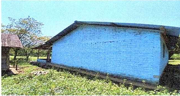
Foto1: Se trabajara el cambio de entechado ya que las laminas ya se encuentran detereorado.