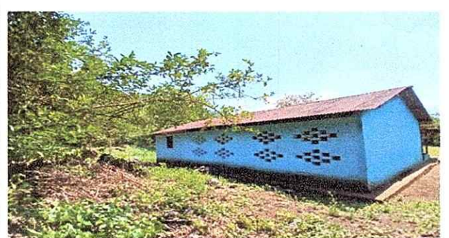
Foto 4: Se realizara el cambio de pintura al muro interior y exterior.