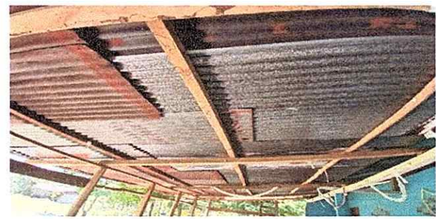
Foto 6: Se trabajara el cambio de cubierta de lamina de la cocina

Observación: Si es necesario se pueden agregar hojas adicionales y actualizar el número de hojas.