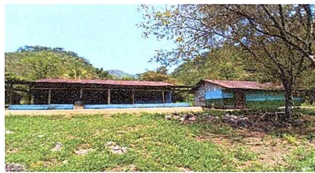
Foto 3: se construira una nueva cocina con piso nuevo y entechado y algunos utensilios.